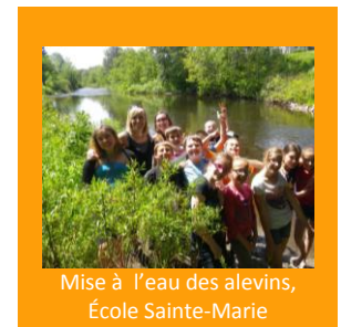
Mise à l'eau des alevins, École Sainte-Marie

L'OBVNEBSL a poursuivi le programme éducatif Écol'Eau dans les écoles primaires et secondaires des secteurs des rivières Trois-Pistoles, Rimouski, Mitis et pour la première fois, Matane. En effet, deux aquariums à saumons ont été achetés pour ce secteur couvrant ainsi l'ensemble du territoire avec les activités prévues au programme. Ainsi, près de 450 élèves parmi onze écoles primaires et secondaires ont pris part à différents volets de ce programme. D'abord, 232 élèves ont eu la