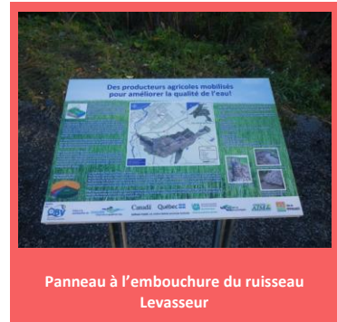
Panneau à l'embouchure du ruisseau Levasseur

La dernière étape du vaste projet de gestion intégrée du secteur agricole du bassin versant du ruisseau Levasseur a été réalisée cette année par une mise en valeur visuelle des travaux. En effet, deux panneaux de sensibilisation sur les efforts consentis pour la mise en valeur du bassin versant de ce ruisseau lors du Plan d'action concerté sur l'agroenvironnement et la cohabitation harmonieuse (PAC) entre 2007 et 2011 ont été installés à son embouchure, mais également au niveau d'un terrain d'une entreprise agricole participante. Ce dernier panneau est d'ailleurs visible en voiture de la route du Panorama à Rimouski. Ces derniers mettent en valeur les différents aménagements réalisés sur les terrains agricoles en plus des partenaires impliqués dans le projet. Ces panneaux ont été réalisés grâce à un financement de l'UPA.