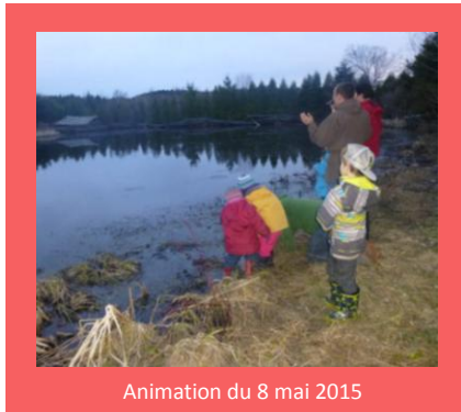
Animation du 8 mai 2015

Le 8 et 9 mai dernier, dans le cadre du 10 e anniversaire du 24h de Science ! , une foule d'activités gratuites en science a été présentée au quatre coins de la province. Dans le Bas-Saint-Laurent, 45 activités de science ont attiré 5283 personnes! Comme l'année dernière, cette région compte parmi les meilleurs bilans de participation au 24h de Science! Dans ce contexte, l'OBVNEBSL a offert une activité grand public en lien avec le thème de cette année: la lumière. Cette activité s'est