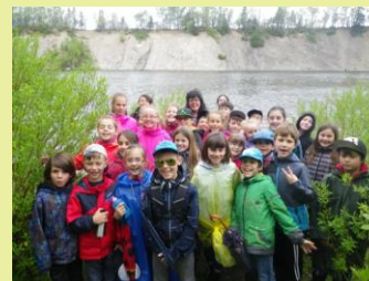
Mise à l'eau d'alevins de saumon, riv. Mitis