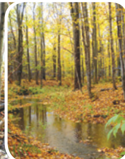
Projet rivière Boyer Sud