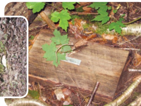
Planchettes de bois servant d'abris pour les salamandres Projet rivière Boyer Sud