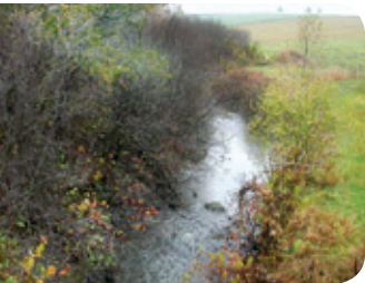
Aulnaie - Projet rivière Fouquette

Les friches et les aulnaies (bosquets d'arbustes d'aulnes) sont des milieux très fréquentés par la tortue des bois et les couleuvres. La conservation de ces milieux permet de maintenir des zones d'alimentation, des abris et des endroits pour réguler la température corporelle de ces reptiles.