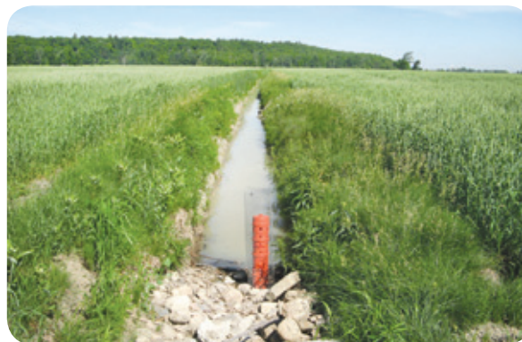
Fossé avaloir « adapté » - Projet ruisseau Richer

Entretien et recommandations • Il est recommandé de vérifier le niveau de l'eau durant les premières années, surtout au moment du dégel printanier et lors de fortes précipitations, afin de s'assurer que l'avaloir évacue adéquatement l'eau. Il faut également s'assurer que l'eau se maintient suffisamment longtemps dans le fossé pour permettre aux espèces présentes de terminer leur cycle de reproduction.