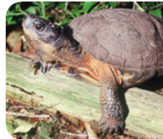
Tortue des bois Jean-Sébastien Hébert

Durant l'hiver, certaines tortues hiberneront dans les fonds vaseux des petits cours d'eau, les rainettes et la grenouille des bois iront plutôt s'enfouir sous les feuilles ou dans le sol, afin d'éviter le gel, alors que plusieurs autres hiberneront sous l'eau (ouaouaron, grenouilles léopard, des marais et verte).