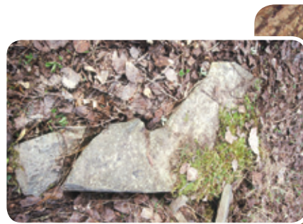
Parterre forestier avec abris pour les couleuvres / Jean-Sébastien Hébert

Entretien et recommandations • Les abris aménagés nécessitent très peu d'entretien. Leur stabilité devra être vérifiée à l'occasion. En forêt, à la suite de travaux de coupe, il est recommandé de laisser des débris ligneux au sol et des pierres, puisqu'ils servent d'abris à plusieurs espèces.