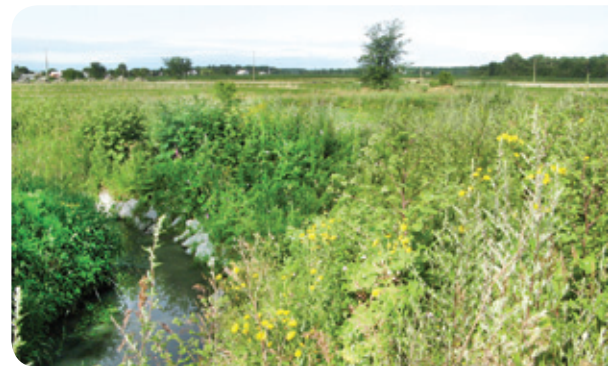
Berges stabilisées après 2 ans - Projet ruisseau Richer

Entretien et recommandations • Les berges stabilisées et le lit du cours d'eau doivent être inspectés régulièrement afin d'en vérifier la stabilité et de prévenir l'érosion. Ces aménagements doivent être planifiés et réalisés avec la collaboration d'un spécialiste afin d'en assurer l'efficacité, la durabilité et l'obtention des permis nécessaires.