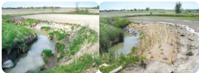
À GAUCHE - Problèmes d'érosion Projet ruisseau Richer À DROITE - Travaux de reprofilage et stabilisation Projet ruisseau Richer

Description • Le profilage des berges en pente douce et la plantation de végétaux dans les berges sensibles à l'érosion permettent de les stabiliser. Un enrochement en pied de talus est parfois requis. L'enrochement peut toutefois occasionner une augmentation de la température de l'eau et affecter les déplacements des amphibiens et des reptiles. L'utilisation de végétaux leur procure des abris contre les prédateurs et des sites d'alimentation.