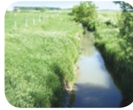
Projet ruisseau des Aulnages

Le fauchage des herbacées le long des fossés doit être évité afin de conserver une bonne humidité au sol. De plus, les bandes riveraines enherbées fournissent des abris et des sites d'alimentation pour plusieurs espèces.