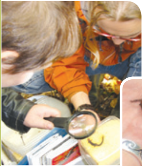
Salamandre cendrée Projet rivière Boyer Sud

Le milieu agricole offre une grande diversité d'habitats pour les reptiles (couleuvres, tortues) et les amphibiens (salamandres, grenouilles, crapauds, rainettes). Ils peuvent être bénéfiques pour l'agriculture, puisqu'ils se nourrissent d'une variété d'insectes et de petits invertébrés comme les limaces.