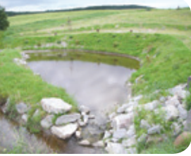
Projet rivière Niagarette

Les bassins permettent d'absorber une partie des eaux de crues et de diminuer la force érosive sur les berges et le fond. Ils créent des sites de reproduction et d'alimentation pour les amphibiens et les reptiles.