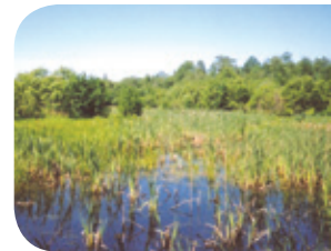
Projet rivière des Envies

Les marais, marécages et étangs sont des habitats riches en biodiversité. Ils constituent un excellent garde-manger pour les amphibiens et les reptiles, tout en leur offrant de bons sites de reproduction et d'hibernation.