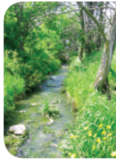
Projet rivière Saint-Pierre

Les arbres et les arbustes en bande riveraine fournissent de l'ombre au cours d'eau et permettent d'abaisser la température de l'eau. La diversité d'insectes est alors augmentée, procurant ainsi un site d'alimentation intéressant pour plusieurs espèces, qui peuvent aussi s'y réfugier, à l'abri des prédateurs.