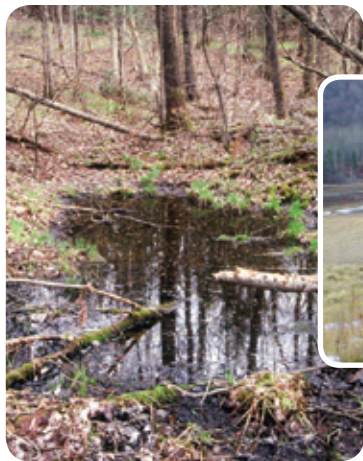
Étang temporaire dans un champ Projet rivière des Envies

But visé • La conservation de ces milieux permet de maintenir ou de rendre disponibles des sites printaniers de reproduction utilisés par plusieurs espèces de grenouilles et de salamandres. Les reptiles, quant à eux, s'en servent comme aires d'alimentation et de repos.