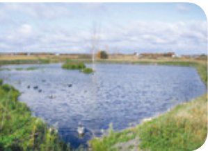
Projet rivière Boyer Sud

Des étangs peuvent être aménagés de façon permanente dans les milieux où le drainage est mauvais et donc moins propice à la culture. Ils fourniront des sites de repos, d'alimentation et de reproduction pour plusieurs espèces.