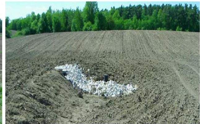
Avaloir avec risberme